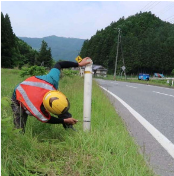
① 既存のデリネーターをカット