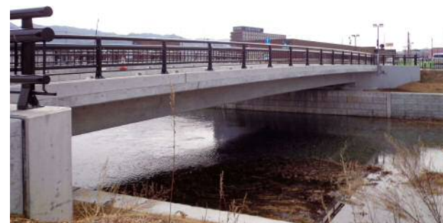
高欄・大船渡市区画整理.JPG