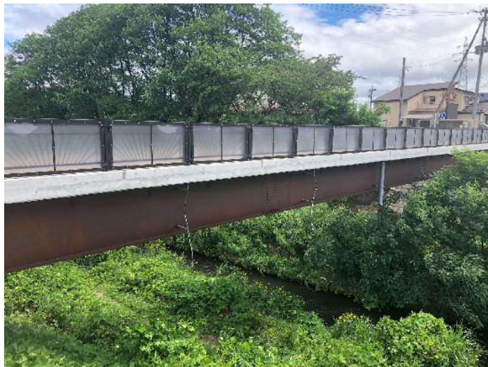
高欄・にじの橋(昼②).jpg