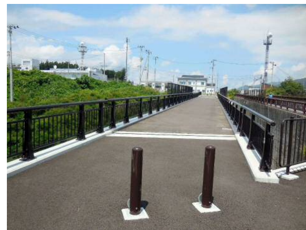
高欄・陸前高田市 水上歩道橋②.JPG