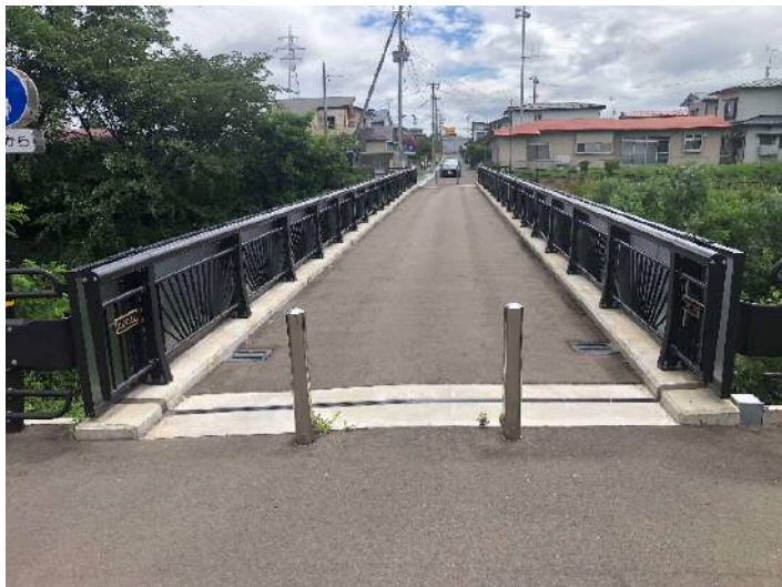
高欄・にじの橋(昼①).jpg