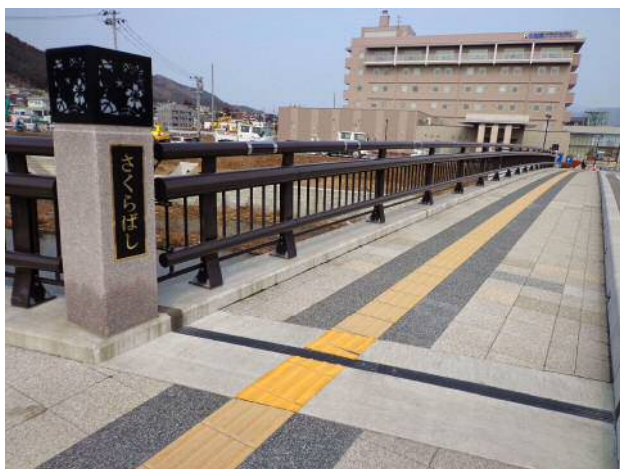
親柱・大船渡市区画整理 .JPG