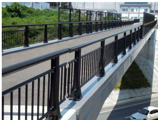
高欄・陸前高田市 水上歩道橋.JPG