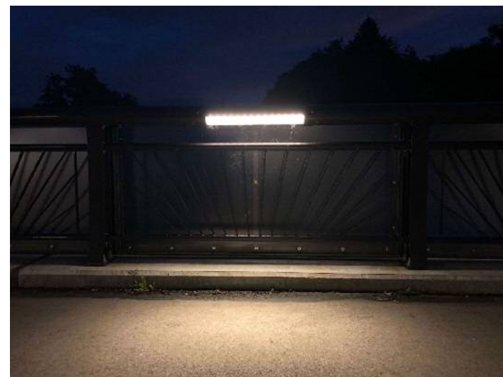
高欄・にじの橋(夜③).jpg