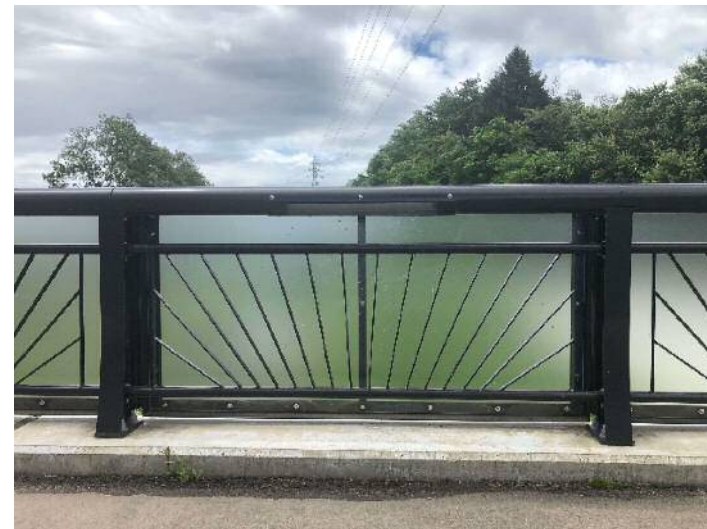
高欄・にじの橋(昼③).jpg