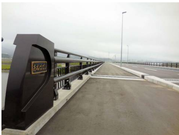
高欄・陸前高田市 姉齒橋.JPG