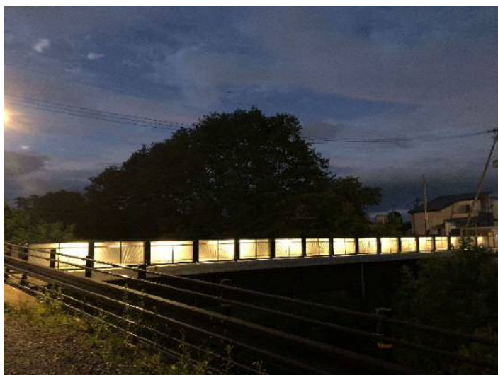
高欄・にじの橋(夜②).jpg