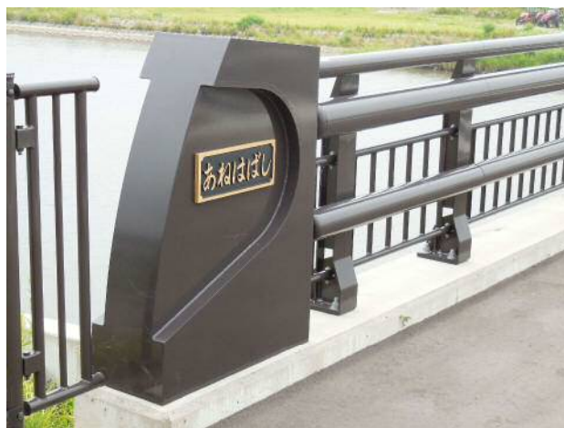
親柱・陸前高田市姉齒橋.JPG