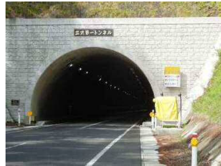
まきえもん・ 国・340号達丸トンネル遠野側...