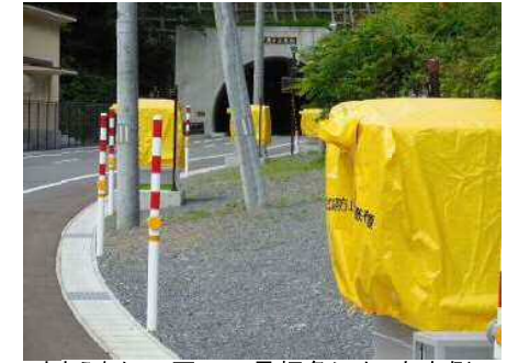
まきえもん・ 国・340号押角トンネル宮古側...