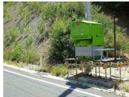
まきえもん・宮古重茂半島線①.JPG