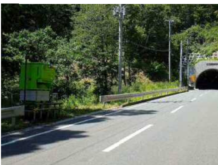
まきえもん・宮古重茂半島線④.JPG