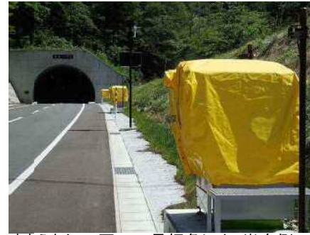
まきえもん・ 国・340号押角トンネル岩泉側.J...