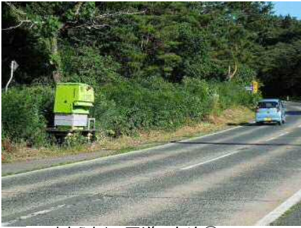
まきえもん・国道 大迫①.JPG