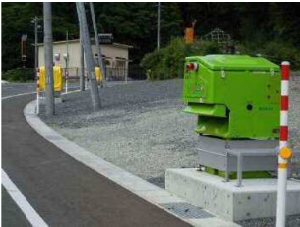
まきえもん・ 国・340号押角トンネル宮古側...