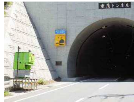
まきえもん・宮古重茂半島線②.JPG