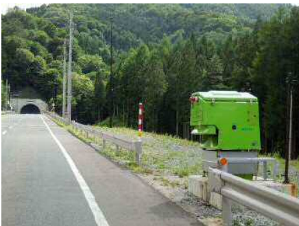
まきえもん・ 国・340号達丸トンネル宮古側...