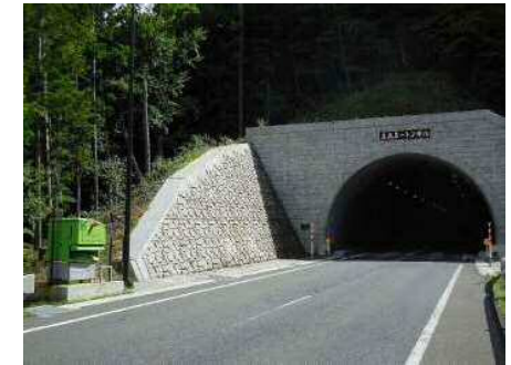
まきえもん・ 国・340号達丸トンネル宮古側...