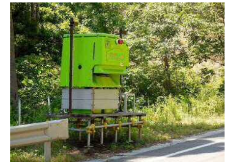
まきえもん・宮古重茂半島線③.JPG