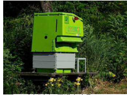
まきえもん・国道大迫②.JPG