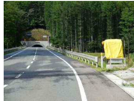
まきえもん・ 国・340号達丸トンネル遠野側...